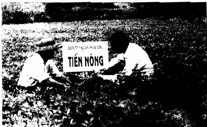
Hình liên nông